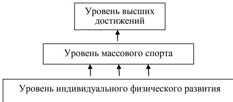
Рис.2. Трехуровневая модель развития спорта как социального института

Саму модель развития спорта мы представляем следующим образом: