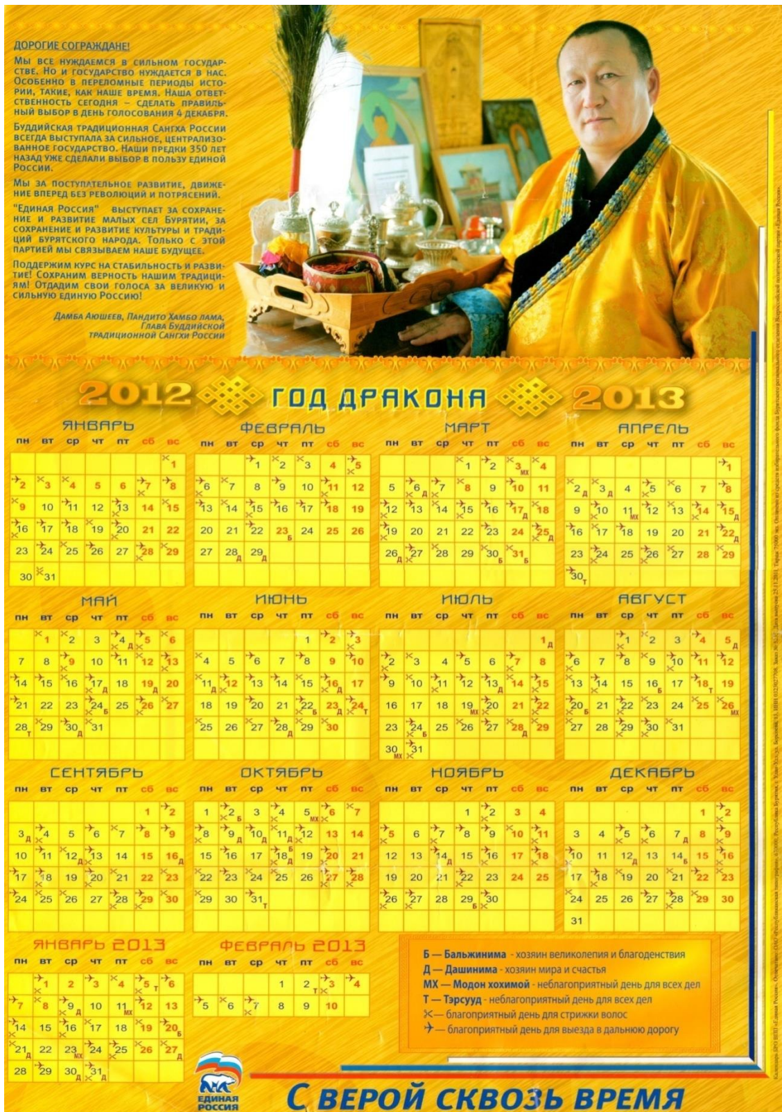
Рисунок 3.1 – Агитационный календарь, в котором глава Буддийской традиционной сангхи России призывает голосовать за конкретную политическую партию.