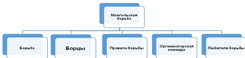
Рис. 1. Составляющие понятия «монгольская борьба»

Если рассматривать монгольскую борьбу как одну из основных составных частей Наадама и как отдельную единую систему, то элементами этой системы является «Борьба» как вид спорта со своими традициями, обычаями, организацией соревнований, который сформировался много тысячелетий назад и являлся основой воспитания многих поколений с учетом исторических, культурных особенностей монгольского народа.