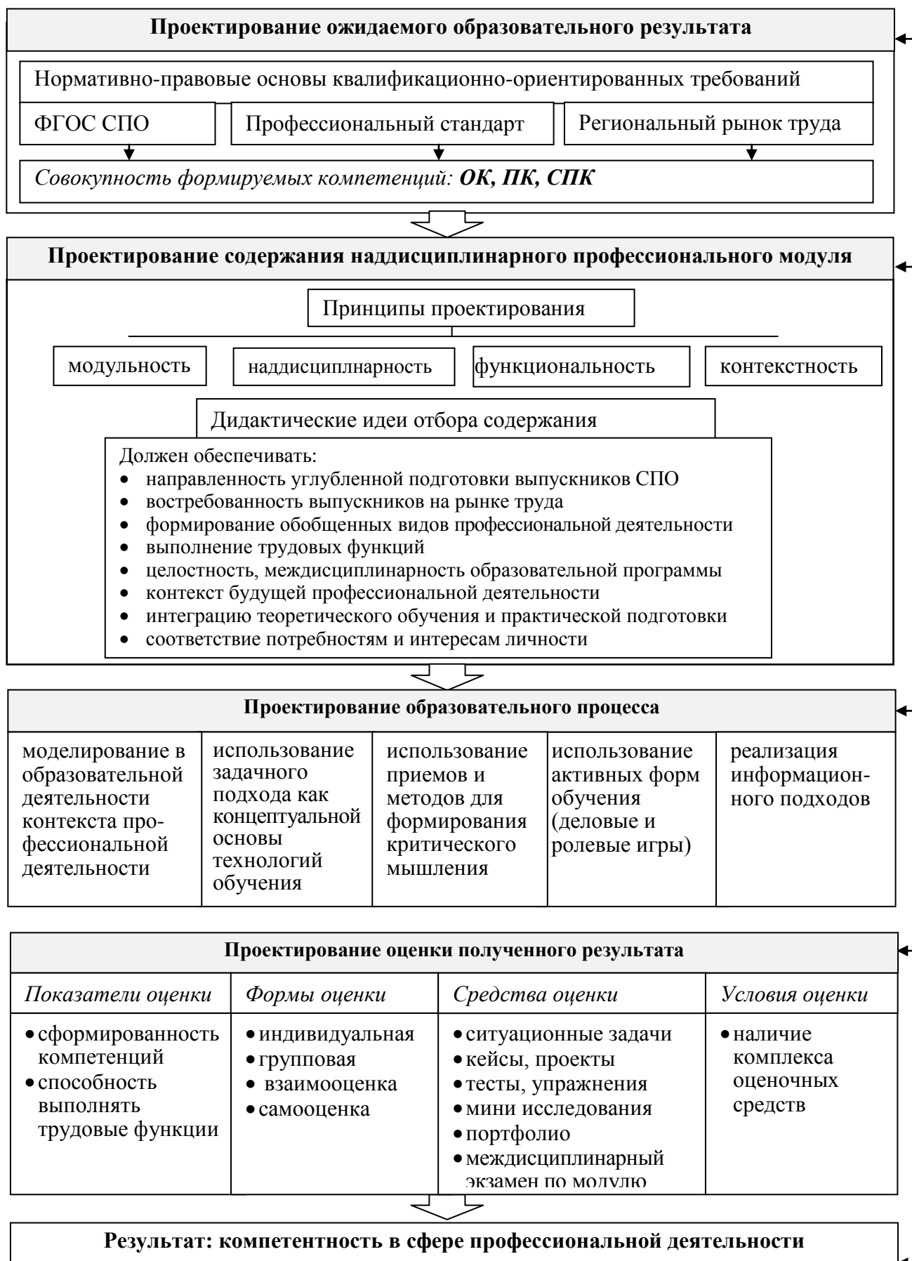
Рис. 1. Организационно-педагогические условия проектирования НПМ образовательной программы СПО углубленной подготовки специалистов