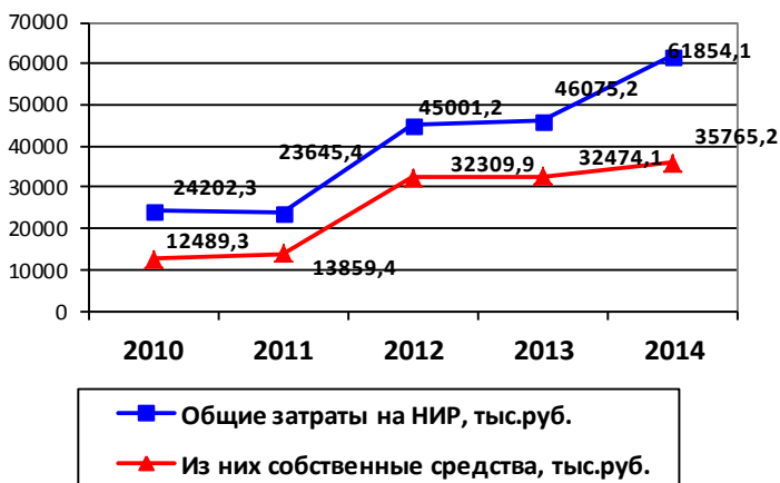
Рис. 2. Затраты на НИР за 2010-2014 гг.