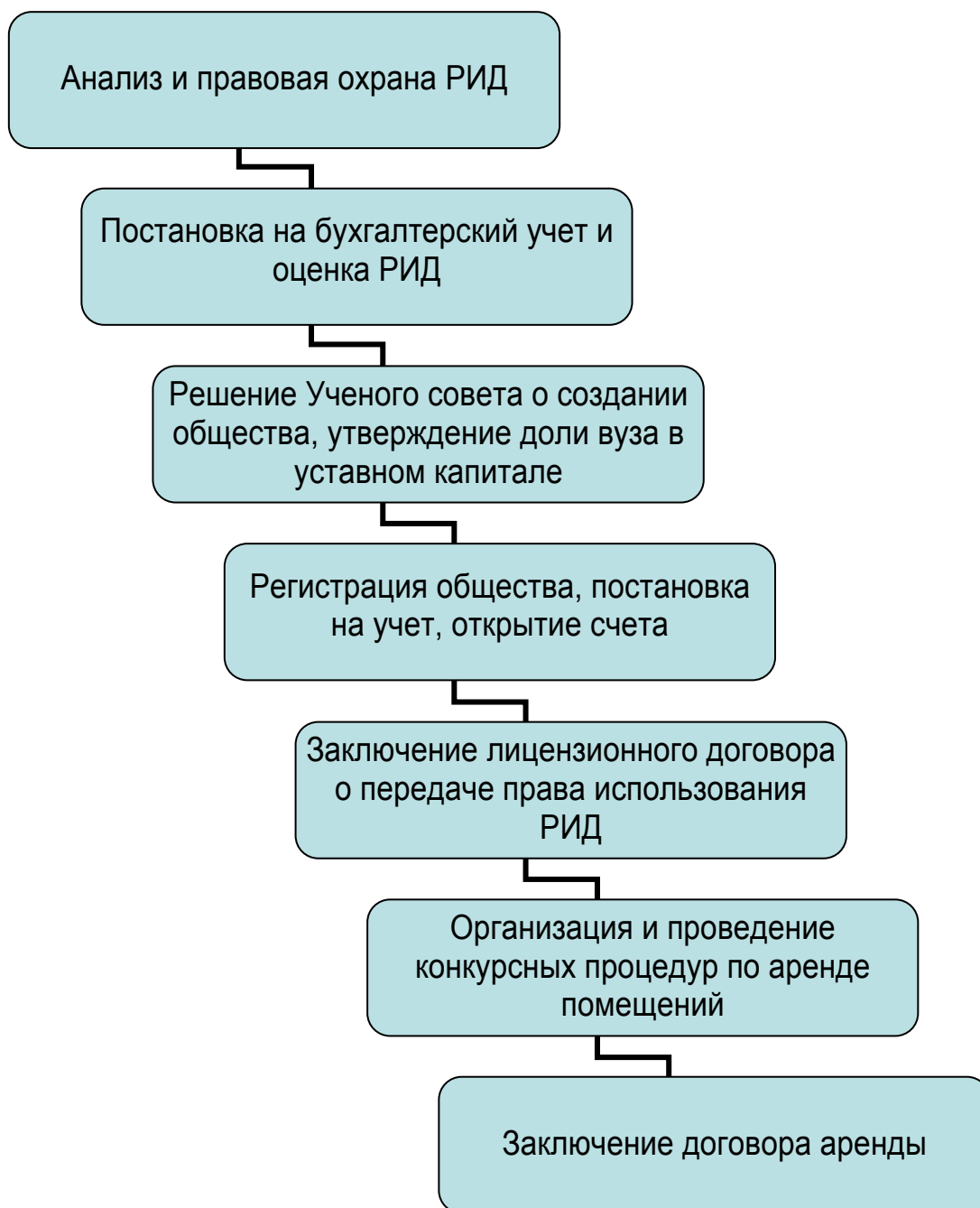
Рисунок I – Этапы создания хозяйственных обществ