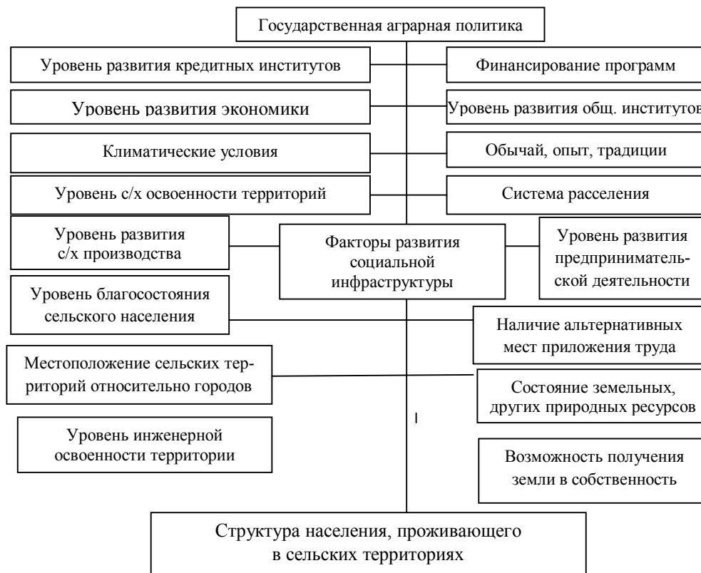
Рис. 1. Факторы развития социальной инфраструктуры сельских территорий

Из рисунка видно, что перечисленные факторы отличаются между собой уровнем и направленностью влияния на развитие социальной инфраструктуры сельских территорий региона. Среди основных уровней влияния можно выделить: федеральный, региональный, муниципальный. Влияние факторов распространяется на экономическую, политическую, юридическую, финансовую, институциональную, экологическую, социальную, демографическую сферы. Анализируемые факторы имеют как прямой, так и косвенный характер влияния. При этом действие отдельных косвенных воздействий имеет существенный характер. Следует заметить, что факторы развития социальной инфраструктуры связаны с устойчивым развитием сельских территорий в целом и отраслевого хозяйственного механизма, ориентированного на обеспечение продовольственной безопасности страны.