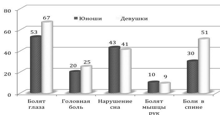
Физические неудобства при работе за компьютером (в % по группам)

Итак, опрошенные студенты подтверждают позитивные функции Интернета, но один из фокусов внимания обследования был связан с оценками и осознанием учащейся молодежи негативных проявлений данного вида коммуникации. На вопрос, считают ли они Интернет негативным явлением, больше половины (57%) ответило отрицательно, каждый третий – согла-