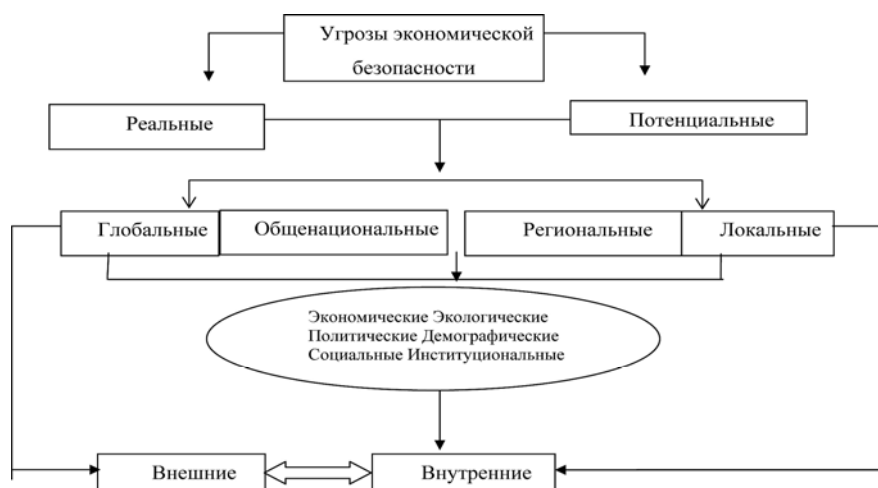
Рис. 2. Схема классификации угроз экономической безопасности

Основываясь на предложениях Е. Д. Кормишкина, нами была дополнена классификация угроз экономической безопасности, в которую введены институциональные и региональные угрозы, при этом предложено разделить угрозы на регионально-локальные и глобально-общенациональные, что связано с нашими исследованиями экономической безопасности на региональном уровне (рис. 2).