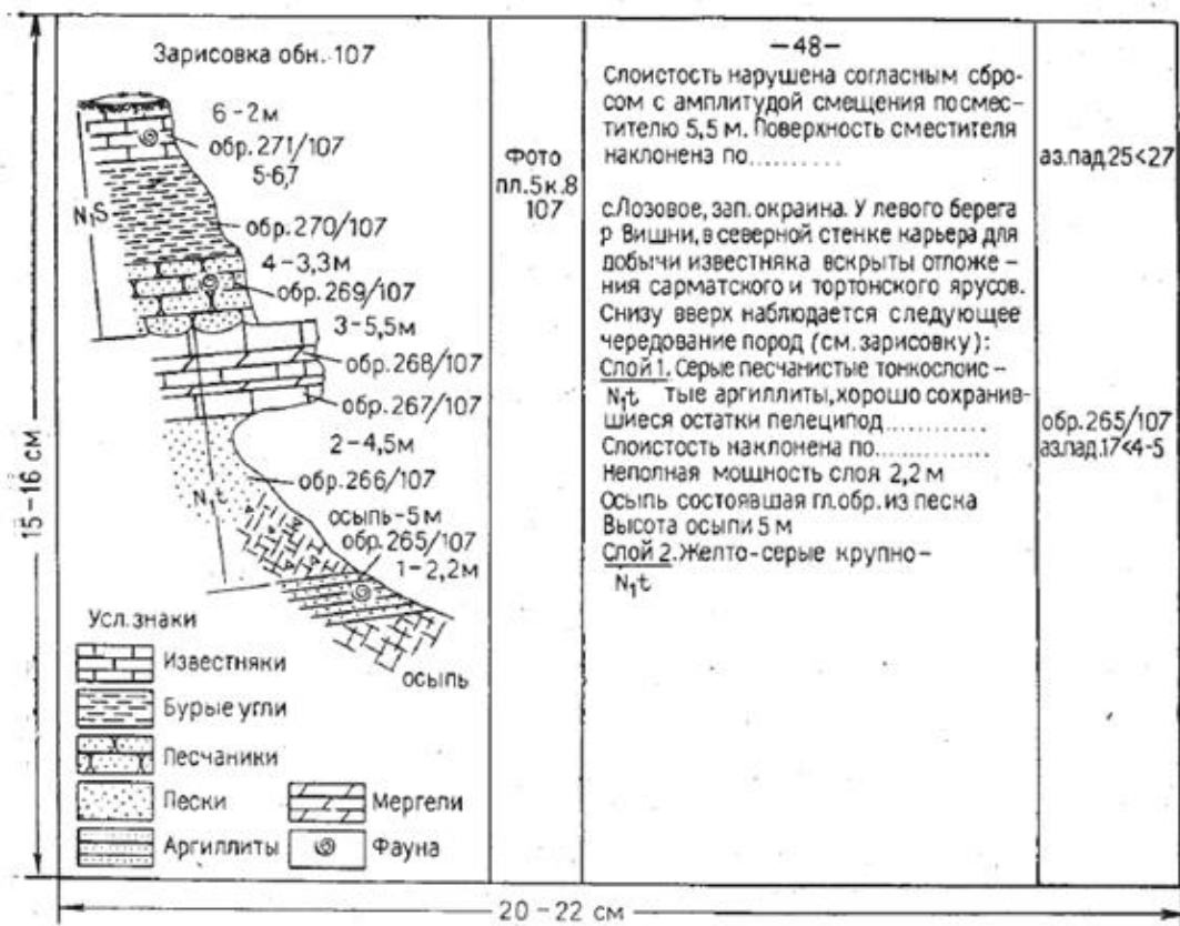
Рис. 1. Общий вид записей в полевом дневнике

На рис. 1 приведен образец записей в полевой книжке. На полях, очерчиваемых на левой странице книжки, ставится номер точки наблюдения. Справа в колонке для записей указывается подробный адрес точки, а затем следует описание. На правых полях этих страниц указываются: номера образцов, замеры элементов залегания жил, разрывов и т. д. Для того чтобы определять назначение замеров, их следует подчеркивать особыми знаками, например; замер элементов залегания - чертой сверху и снизу, замеры жил — волнистой чертой, замеры разрывов - пунктиром и т. д. Замеры трещин необходимо сразу же выписывать на одну из левых страниц, в специально разграфленную для этого таблицу. На левых полях следует делать пометки о сфотографированных объектах, пометать особо важные образцы с окаменелостями, рудными и иными минералами.