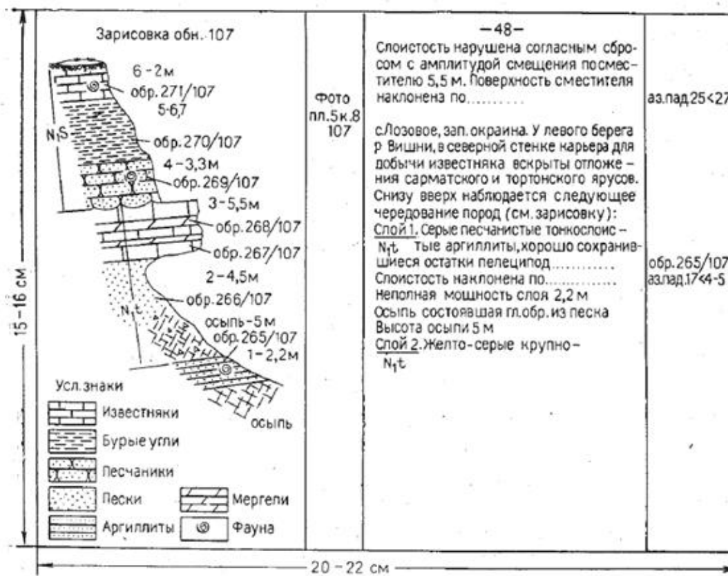
Рис. 1. Общий вид записей в полевом дневнике

На рис. 1 приведен образец записей в полевой книжке. На полях, очерчиваемых на левой странице книжки, ставится номер точки наблюдения. Справа в колонке для записей указывается подробный адрес точки, а затем следует описание. На правых полях этих страниц указываются: номера образцов, замеры элементов залегания жил, разрывов и т. д. Для того чтобы определять назначение замеров, их следует подчеркивать особыми знаками, например; замер элементов залегания - чертой сверху и снизу, замеры жил — волнистой чертой, замеры разрывов - пунктиром и т. д. Замеры трещин необходимо сразу же выписывать на одну из левых страниц, в специально разграфленную для этого таблицу. На левых полях следует делать пометки о сфотографированных объектах, пометать особо важные образцы с окаменелостями, рудными и иными минералами.