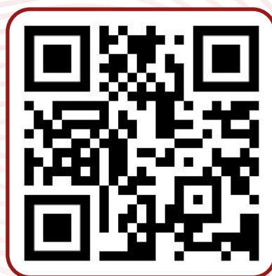
Сообщество ВКонтakte ИПЭ БГУ